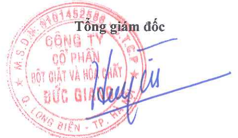
Đào Hữu Huyền