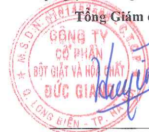
Đào Hữu Huyền